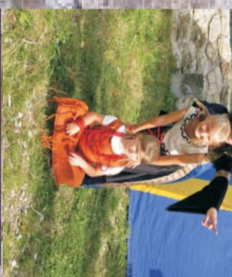
Elisabeth mit Begleitung