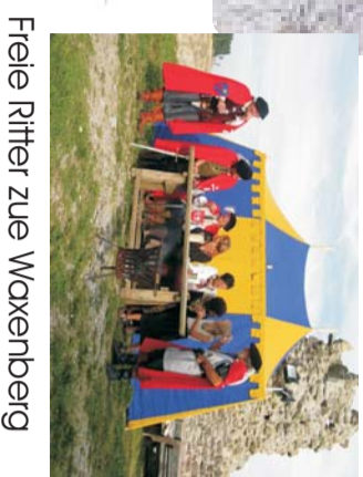
Freie Ritter zue Waxenberg